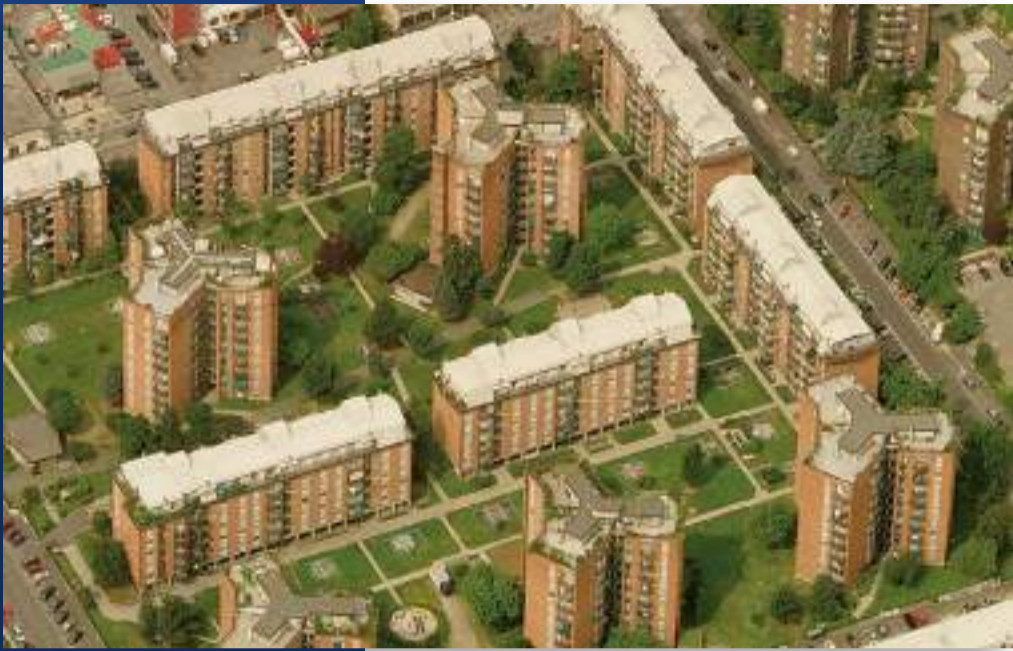
Quartiere Giradino (Cesano Boscone)

nel processo di restauro e riqualificazione architettonica della Villa. A Milano, Palladium sta sviluppando un piano urbanistico riferito ad aree private e pubbliche posizionate nel quadrante Nord-Ovest della città: l'area privata oggi dismessa sarà trasformata in un nuovo distretto residenziale composto da circa 350 nuovi appartamenti realizzati in linea con le recenti esigenze e richieste abitative, mentre l'area pubblica rigenera e riconsegnata alla città con una nuova viabilità più sostenibile e spazi a verde attrezzati e aperti a tutti. Per quanto riguarda l'Europa, in Olanda e in Belgio il Gruppo ha intrapreso un percorso che mira a trasformare uffici in edifici a destinazione residenziale, in linea con le indicazioni locali e verso un risparmio di consumo del suolo. A Delft, città prossima a L'Aia, un piano promosso dalla Amministrazione Comunale mira a rigenerare un intero "business district", dei quali edifici uno è di proprietà di Palladium, in un nuovo quartiere residenziale, allo scopo di soddisfare la crescente domanda interna di abitazioni dei diversi