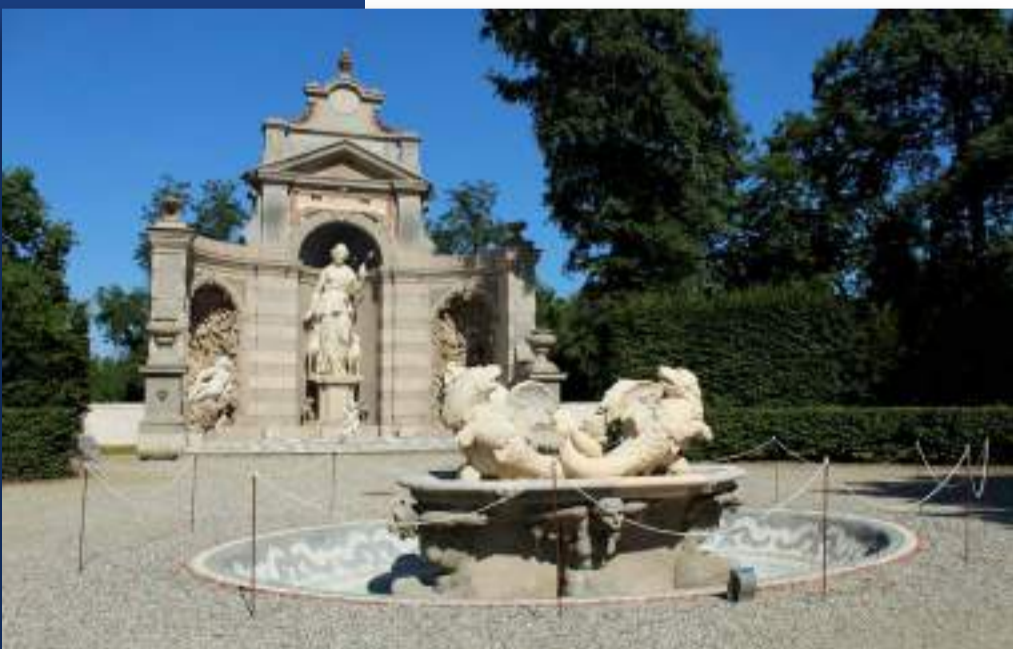
Villa Arconati (Bollate)

segmenti (social, student, middle e high-end). A Bruxelles, è stato completato lo scorso anno un identico processo e si stanno valutando iniziative simili. In Francia, a Parigi, ci stiamo distinguendo per un processo di trasformazione di un nostro edificio locato