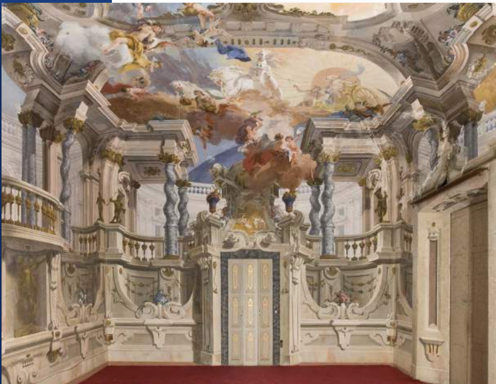
Villa Arconati (Bollate)

Il Gruppo nel suo insieme ha assorbito discretamente bene le conseguenze della pandemia, grazie alla disponibilità e dedizione di ognuno di noi, così che si è continuato a svolgere le proprie mansioni. Ciò è stato fondamentale soprattutto per garantire i servizi di gestione degli immobili e i servizi per i nostri "tenant" che non sono mai venuti meno in nessuna delle fasi della pandemia, permettere lo svolgimento di tutte le attività ordinarie, e continuare a seguire le attività di sviluppo di tutti i nostri progetti.