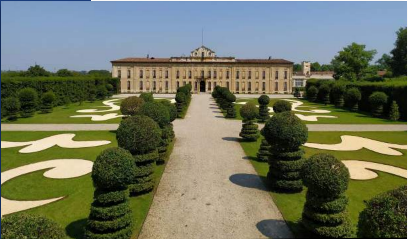
Villa Arconati (Bollate)

rispettosi del contesto urbano, si inseriscono nella cultura del luogo e sono protesi a soddisfare i bisogni e la domanda che emerge dalla comunità locale.